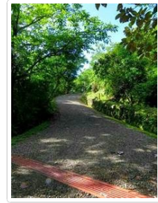
Aguas y caminos 11