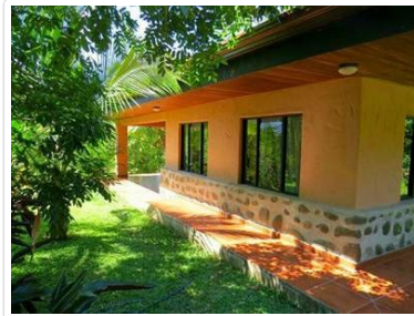
Casa 4 (4)