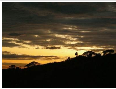
D plex 86.1