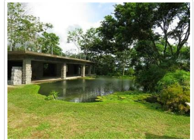
Casa obra 1.5