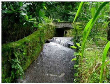
Aguas y caminos 18